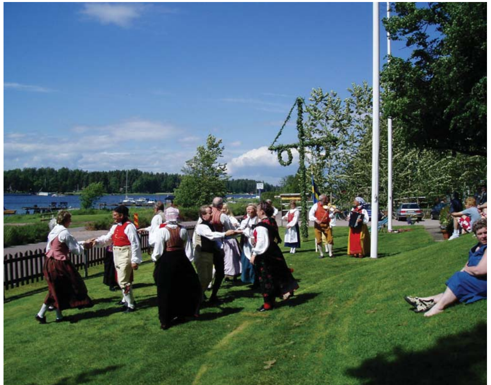
Traditionellt midsommarfirande i Vålösundet.

Området avses betjäna behovet av lek och friområden inom parkmark för såväl besökare som för boende inom planområdet. Förutom en privatägd fastighet som är planlagd som hamnområde är området mellan Vålösundsvägen och vattnet allmänt tillgängliga. Ett annat undantag är de mindre områden som i planen avsatts för parkering respektive hamnändamål. I området mellan vägen och vattnet finns på vissa platser iordningsställda sittplatser, dessa föreslås en upprustning och ytterligare sittplatser skulle kunna tillskapas.