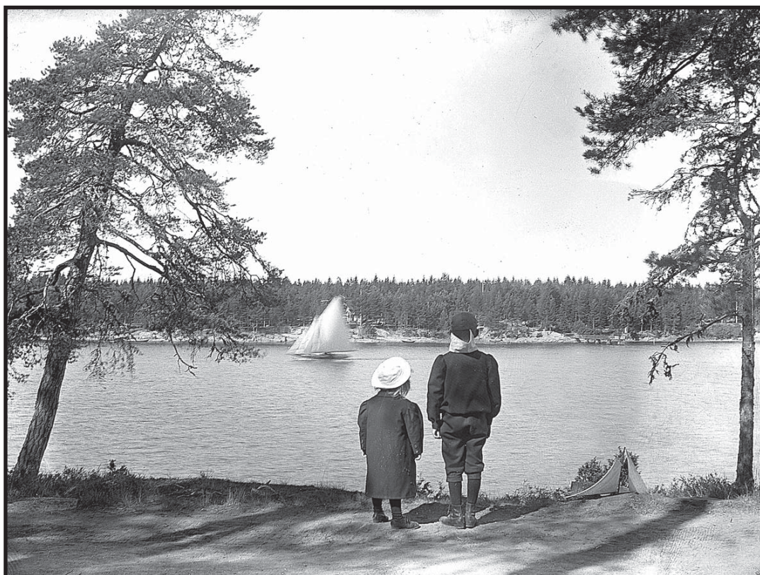
Historisk bild från Vålösundet.

Antagen av kommunfullmäktige i Kristinehamn enligt beslut 2013-06-18, §78