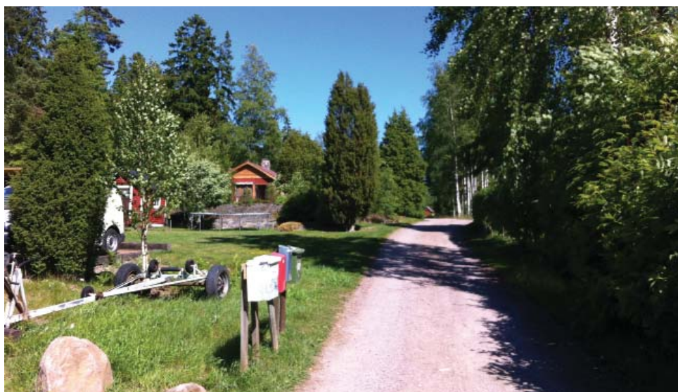
Exempel på vegetation mellan fastigheter inom planområdet.