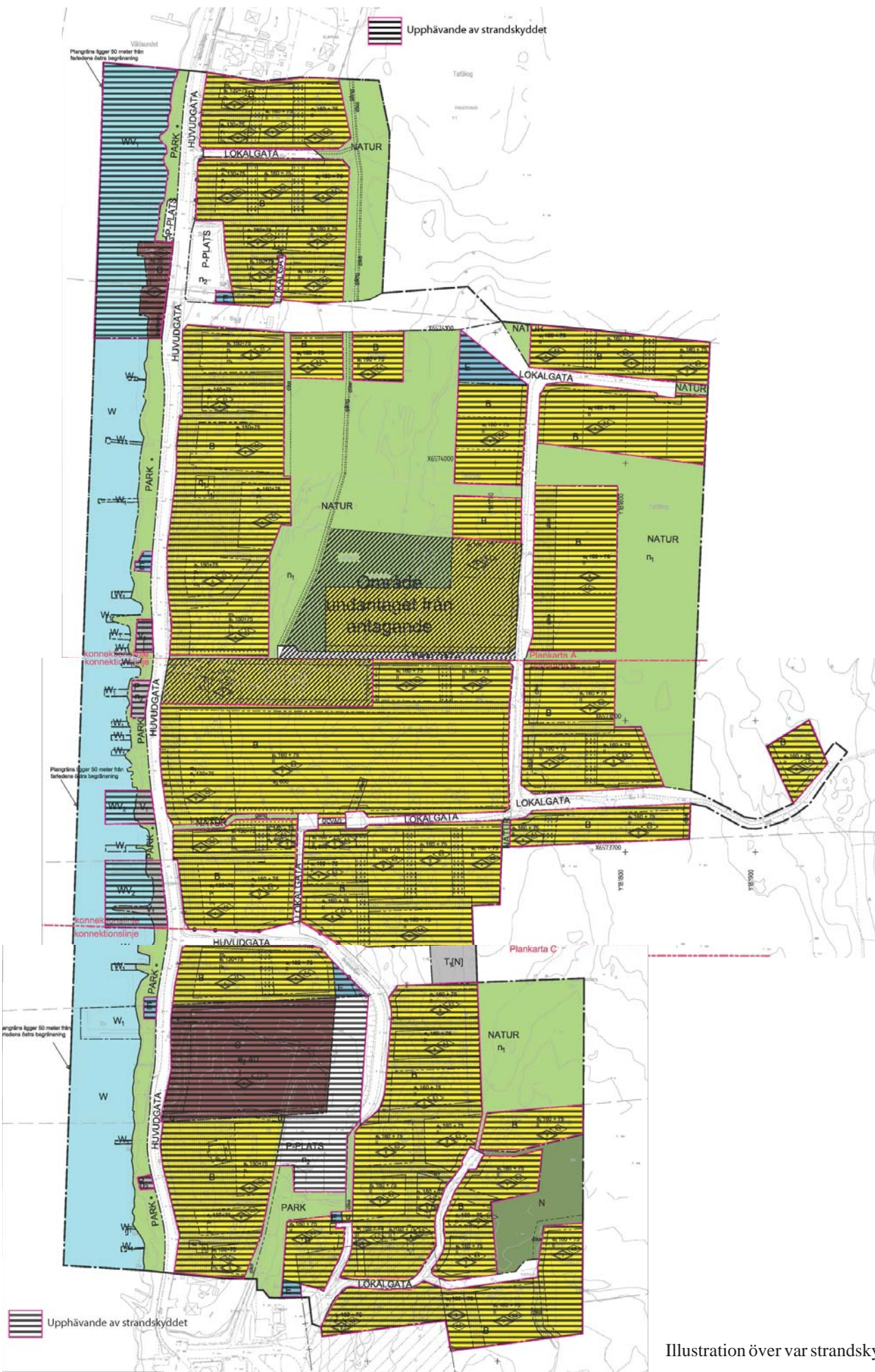
Illustration över var strandskyddet upphävs.